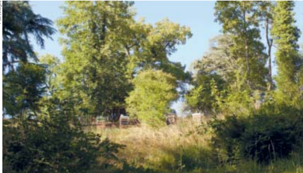
Ruches au Parc des Falaises.

Découvrez chaque mois une nouvelle activité vous garantissant une expérience unique et 100% nature