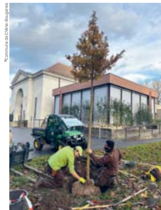
Mise en terre d'un chêne de Hongrie par l'équipe des parcs et promenades devant la salle communale.