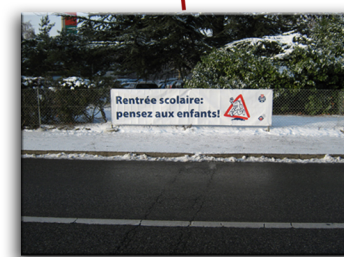
3 - Route de Jussy