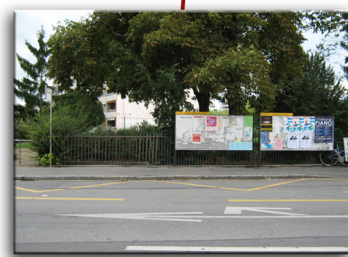
2 - Avenue Tronchet