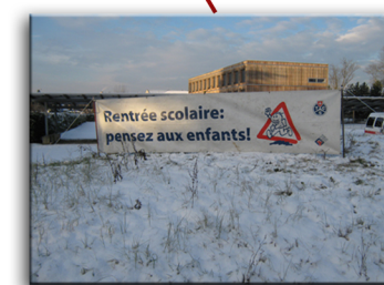
4 - Route de Jussy