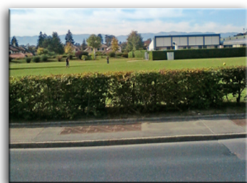
1 A - Avenue de Thônex