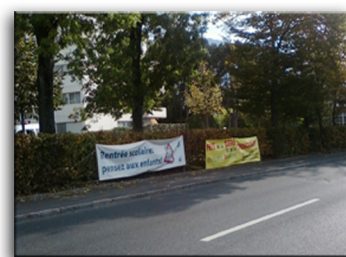
1 B - Avenue de Thônex